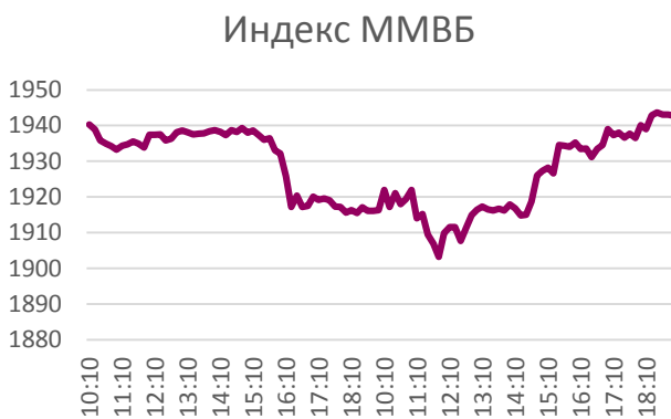
График индекса ММББ