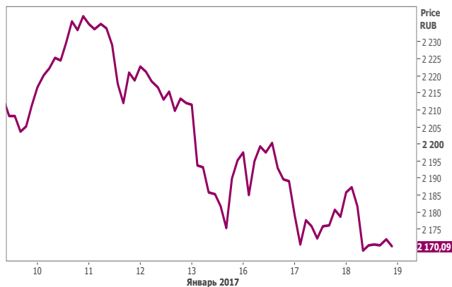
График индекса ММВБ (60 мин.)

Операционные результаты представят Евраз и Дикси за 4 кв. 2016 г.