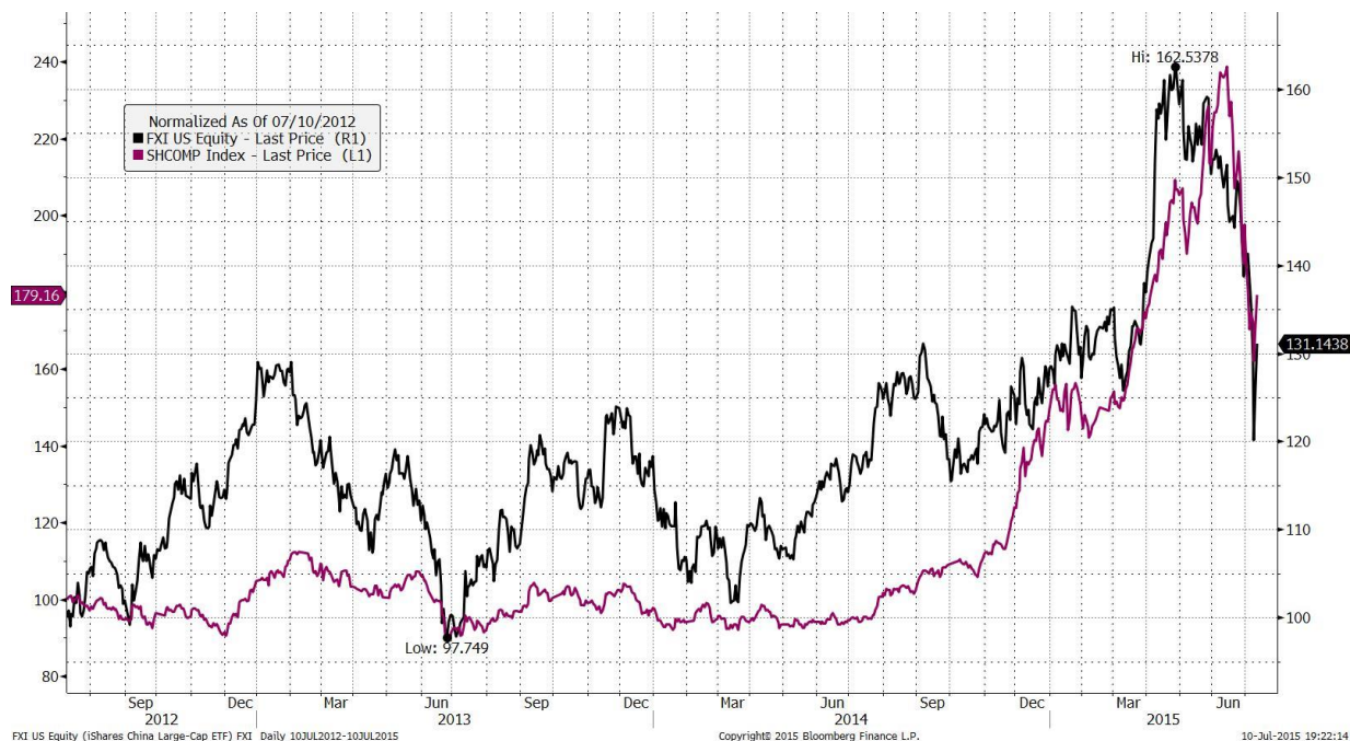
График 2 Динамика фонда IShares China Large-Cap ETF и Shanghai Composite с 2012-2015 гг

Источник: Bloomberg, график нормализован с 2012 года