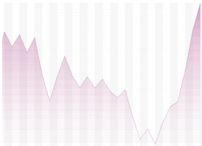
График индекса ММВБ (60 мин.)

Начала торгов во вторник ждем вблизи закрытия понедельника, но в течение торговой сессии не исключаем отката на 15-20 пунктов по индексу ММВБ.